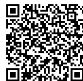
進廣部網站 QR Code