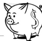
原私校退撫基金(舊制) 110年度1月至9月期間收益率